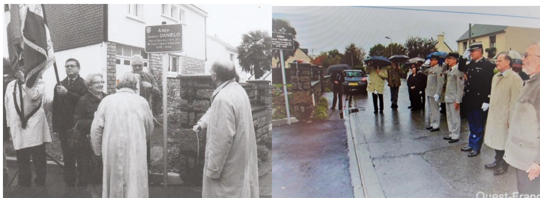
Inauguracion di e caya na nomber di Gaston Danielo

E avion tabatin un bida cortico di solamente dies siman door cu el a ser bombardea y basha abou riba su di 29 mision di guerra den e bataya aereo contra cuatro Focke Wulf FW190 Aleman riba e Canal Ingles dia 30 di april 1942 y Danielo a perde su bida. E tabatin solamente 118 ora y 20 minuut di tempo di vuelo, den Squadron 118. Den e squadron aki tabatin tres piloto Hulandes tambe.